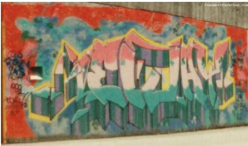
Eljay, Sønderborg 1998. Denne her er en tilbagevenden til en mere universel bogstavstil, tydeligt inspireret af især mesteren Bates, der dengang var up and coming, og jeg var på 'studietur' i Kbh. Jeg var så heldig at blive optaget i det klassiske københavner-crew PCP, og hentede megen inspiration og lærdom fra disse skrappe kids..

Graff rules, og denne helt igennem heftige og højklorte ekstrem-kultur vil ALTID vinde over vanetænkende salonkunstneres 'bedrevidende' hovedrysten og nedgørelse forsøger at absorbere, uskadeliggøre, kastrere, og trække tænderne ud på Farvernes Oprør.