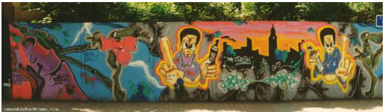
The Crush by ElJay, Sønderborg 1988

Solide shoutouts til alle der gør deres ting med stolthed og skillz indenfor graff-kulturen, gamle som nytilkomne. Let's keep this planet rockin'! ElJay/L:Ron/Lars Jensen