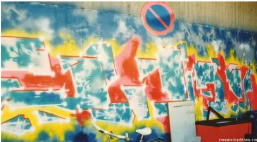
Eljay, Sønderborg 1987. Er inspireret delvist af Futura 2000 og hans ting, delvist af den 'hollandske' - Mode2'ske bogstavstil, der dominerede i de år. det er jo lavet ud standarddyser, ting tog tid dengang.... jeg forsøgte også at indarbejde elementer fra New York'sk klassisk computerrock wildstyle, men uden den som regel massive 3i herhjemme nok finest repræsenteres af Sabe - min all time 'King' om nogen, på den danske scene.

Visse af væggene har jeg malet over 30 gange over et tidsmæssigt span på 26 år. Jeg debuterede dernede med et stort, rødt grønt og sort crime-piece hvor der stod 'ri destruktive mennesker besluttet at jævne dette lille stykke af heaven med jorden, og opføre en stor led klods af et kapital-krejlende butikskompleks. Jeg har dog plane med et selvmordsbomber-bælte på demolition-day... Jeg er 43 nu, men elsker om muligt at male endnu mere end for say 10-15 år siden, hvor jeg ellers også bragede ç enkelte steder i nordtyskland. Jeg er de seneste par år begyndt at lave mange characters, og nyder opprioriteringen af denne ædle aerosol-æstetiske disciplin meget.