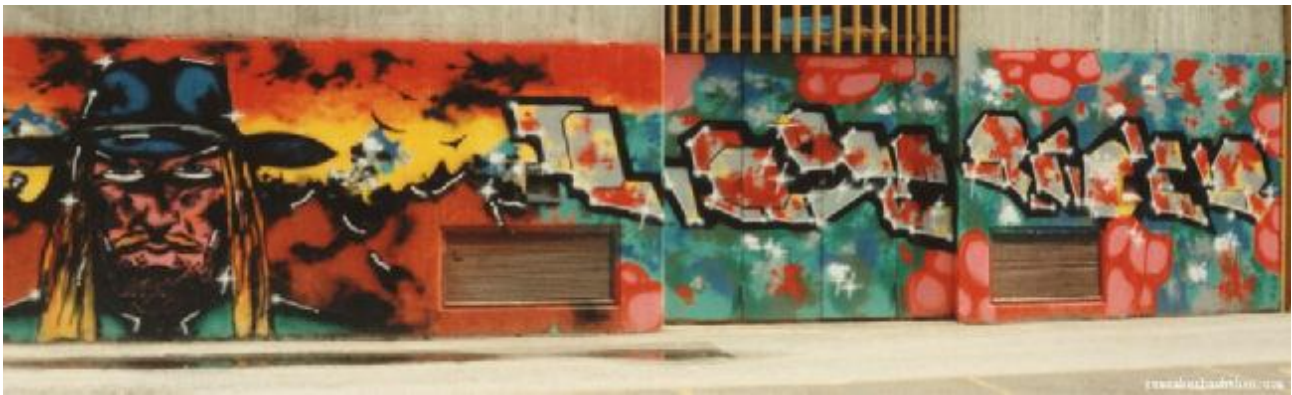
Character + Lone Rider af Eljay, Sønderborg 1987

Beton-hulen har altid været lig med 'undergrund' i Sønderbog. Breakere, skatere, punkere, punks pimps & prostitutes... Alle har de haft deres gang på dette sted, hvis aerosol-ætsede intellekter som mit..