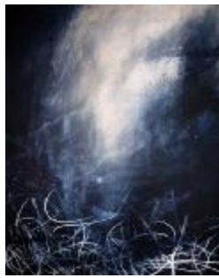
326 lærred 100 x 80 5.000