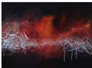
313 lærred 90 x 120 7.000