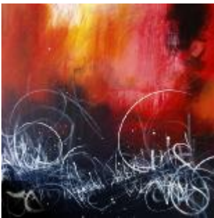
325 lærred 90 x 90 6.000