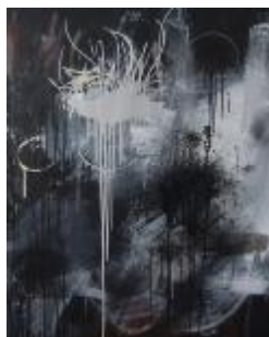
314 lærred 100 x 80 5.000