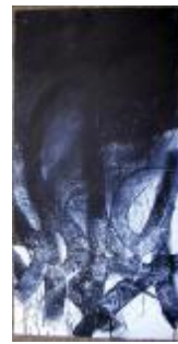
327 lærred 100 x 50 4.000