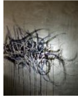
324 lærred 100 x 80 5.000