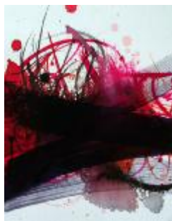
332 papir 30 x 24 500