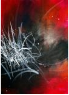
322 lærred 80 x 60 5.000