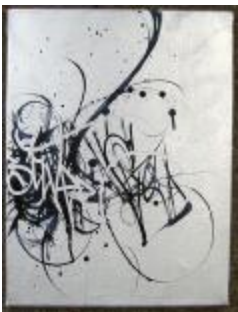
328 lærred 40 x 30 1.500