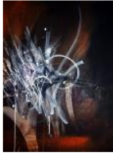
323 lærred 80 x 60 5.000