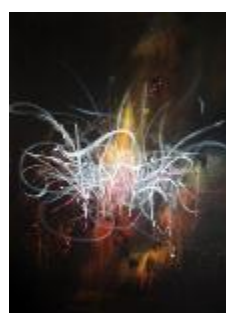
321 lærred 80 x 60 5.000