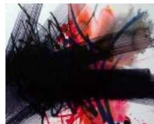
333 papir 24 x 30 500