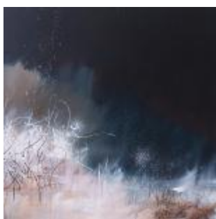
316 lærred 100 x 100 7.000