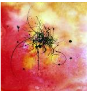
331 papir 40 x 40 800