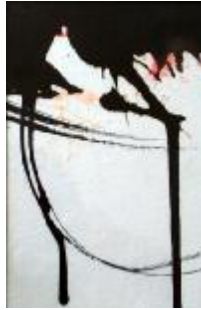
335 papir 14 x 10 200