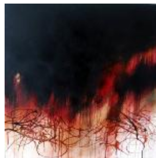
315 lærred 100 x 100 5.000