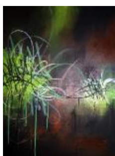
320 lærred 80 x 60 5.000