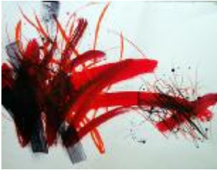
334 papir 50 x 60 600