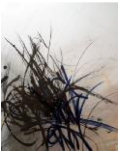
337 papir 50 x 40 1.300