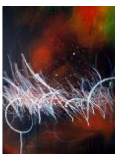
319 lærred 80 x 60 5.000