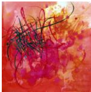
329 papir 40 x 40 800