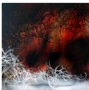
317 lærred 100 x 100 7.000